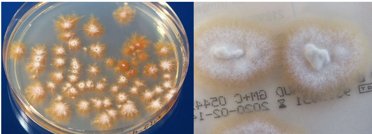
Trichophyton tonsurans – Zwei Isolate von verschiedenen Kindern mit Mykosen der Haut.

Der diese Mykosen verursachende Pilz wird als „Mattenpilz“ oder sogar „Ringerpilz“ bezeichnet. Es handelt sich um den anthropophilen („Menschen-liebenden“) Hautpilz Trichophyton tonsurans . Dieser Erreger kommt nur beim Menschen vor und wird von Mensch-zu-Mensch übertragen. Das geschieht einerseits direkt durch Körperkontakt . Das ist beim Ringkampf sehr wahrscheinlich, auch weil der Haut-zu-Haut-Kontakt sehr intensiv ist durch starken Druck, Stoßen und Reiben der Haut an der Haut des „Gegners“, aber auch an der Mattenoberfläche. Andererseits wird der Pilz Trichophyton tonsurans auch indirekt über unbelebte Oberflächen – Fußboden, hier insbesondere Sportmatten – übertragen.